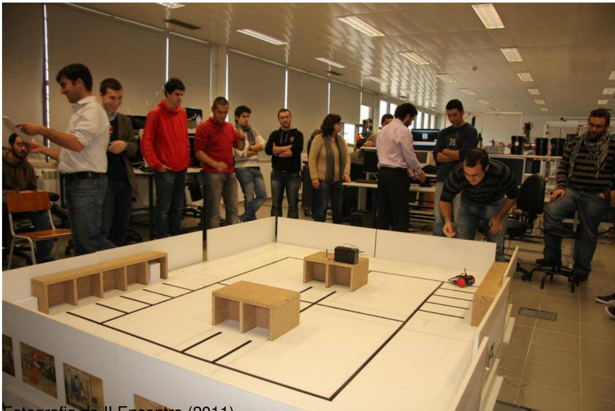
Fotografia do II Encontro (2011).