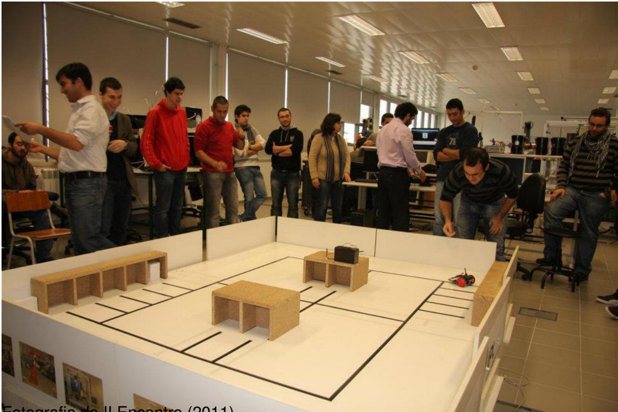
Fotografia do II Encontro (2011).